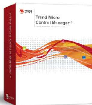
趋势科技防毒墙控管中心—TrendMicro Control Manager